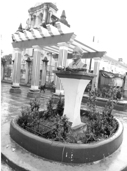
Figura No. 2 Busto de Rafael Girard en el parque del municipio de Jocotán, Chiquimula.